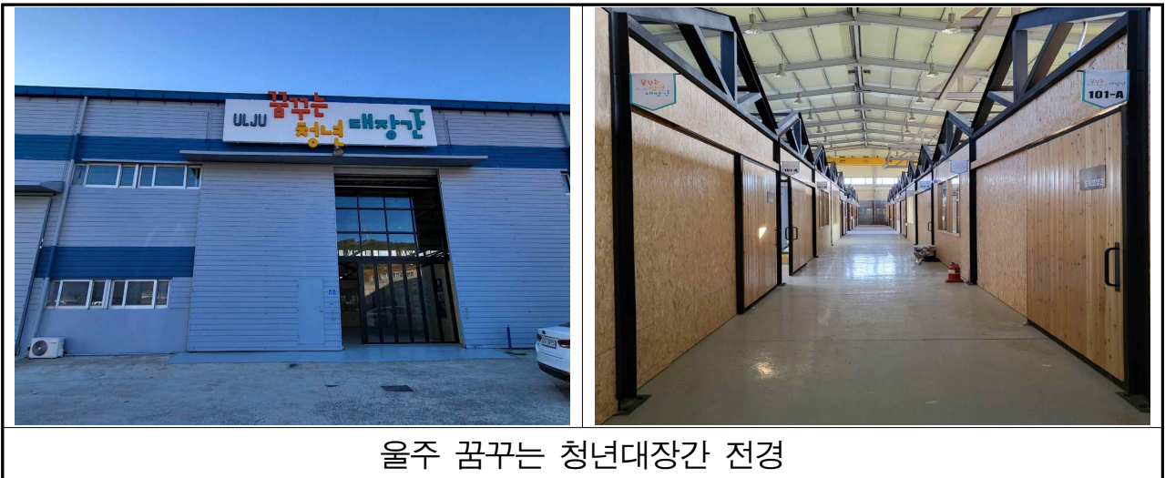
울주 꿈꾸는 청년대장간 전경