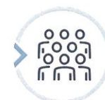
함월[효] 식당 이용