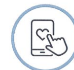
식권발급 (당일 식권에 한함)