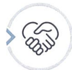
이용 및 참여